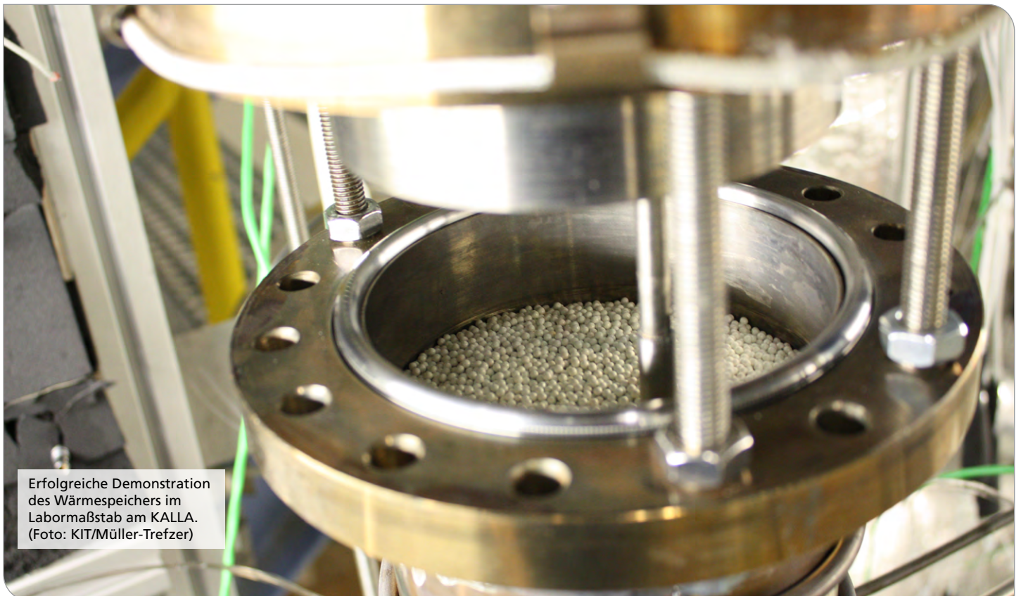
Erfolgreiche Demonstration des Wärmespeichers im Labormaßstab am KALLA.

Am Karlsruher Flüssigmetalllabor (KALLA) wird die Verwendung von Metallschmelzen (sogenannte Flüssigmetalle) als Wärmeträger in Wärmespeichern erforscht. Flüssigmetalle haben den Vorteil, dass sie die Speicherung von Wärme in einem breiten Temperaturbereich und bis zu sehr hohen Temperaturen von ca. 100 °C bis 1000 °C ermöglichen. Zusätzlich erlaubt die hohe Wärmeleitfähigkeit der Flüssigmetalle einen bis zu 100-fach besseren Wärmeübergang im Vergleich zu konventionellen Flüssigkeiten, wie Ölen oder Flüssigsalzen, sowie Gasen. Dies ermöglicht, Wärmeübertrager und Wärmespeicher kompakter zu bauen und eröffnet damit innovative Wege,